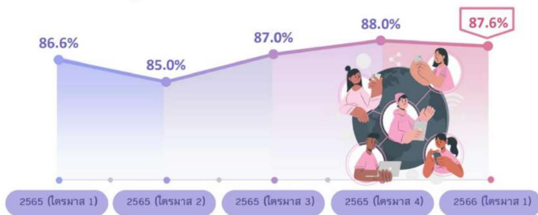
แผนภาพที่ 2 : สถิติการใช้อินเทอร์เน็ตของประเทศไทย ตั้งแต่ปี พ.ศ. 2565 (ไตรมาส 1) - 2566 (ไตรมาส 1) ที่มา : สรุปผลที่สำคัญ สํารวจการมีกรใช้เทคโนโลยีสารสนเทศและการสื่อสารในครัวเรือน พ.ศ. 2566 ของสำนักงานสถิติแห่งชาติ

การเปลี่ยนผ่านสู่ยุคดิจิทัล ด้วยการพัฒนาเทคโนโลยีสารสนเทศและการสื่อสาร โดยประชากรวัยเรียนส่วนใหญ่จะเป็นกลุ่มประชากร Generation Z หรือ Gen Z (ผู้ที่เกิดระหว่างปี พ.ศ. 2539 - 2553) ที่ดำเนินชีวิตประจำวันพร้อมกับสิ่งอำนวยความสะดวกและเทคโนโลยีต่าง ๆ ที่จะทำให้สามารถเข้าถึง สื่อสังคมออนไลน์ได้ง่ายยิ่งขึ้น ซึ่งมีอิทธิพลต่อการเรียนรู้รูปแบบใหม่ เช่น ระบบการเรียนรู้แบบเคลื่อนที่ ผ่านโทรศัพท์มือถือ (Mobile Learning) การเรียนรู้ในระยะเวลาสั้น ๆ ที่มีเนื้อหากระชับและตรงประเด็น (Micro-Learning) การเรียนผ่านสื่อวีดิทัศน์ (Video-Based Learning) และการเรียนรู้ที่ขับเคลื่อนด้วยเกม (Gamification) เป็นต้น อย่างไรก็ตาม ในปัจจุบันประชาชนส่วนใหญ่สามารถเข้าถึงอินเทอร์เน็ตได้อย่างทั่วถึงมากขึ้น จึงมีช่องทางในการแสวงหาความรู้ที่เปิดกว้างมากยิ่งขึ้น 6 เมื่อพิจารณาจากสถิติการใช้อินเทอร์เน็ตของประชาชนอายุ 6 ปีขึ้นไป ตั้งแต่ปี พ.ศ. 2565 (ไตรมาส 1) - 2566 (ไตรมาส 1) จะเห็นได้ว่า อัตราการเข้าถึงและการใช้อินเทอร์เน็ต ของประเทศไทยมีอัตราที่เพิ่มสูงขึ้น รายละเอียดดังภาพต่อไปนี้ 7