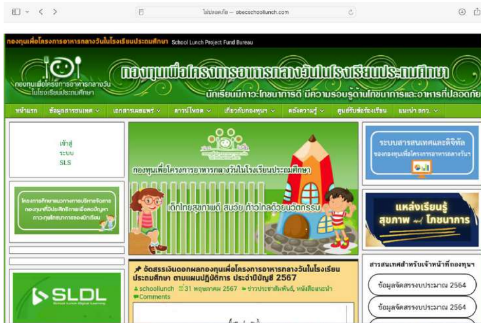
แผนภาพที่ 3 : กองทุนเพื่อโครงการอาหารกลางวันในโรงเรียนประถมศึกษา