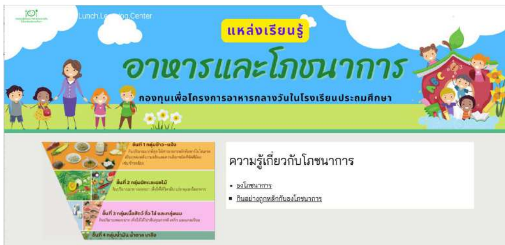
แผนภาพที่ 4 : การศึกษาแหล่งเรียนรู้ เรื่อง อาหารและโภชนาการ จาก website กองทุนเพื่อโครงการอาหารกลางวันในโรงเรียนประถมศึกษา URL https://sites.google.com/view/school-lunch-learning-center/